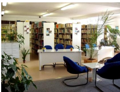
Lekárska knižnica FN v Nitre

Výsledky dotazníkového prieskumu v rámci etickej expertízy v knižniciach budú uverejnené v ďalšom príspevku.